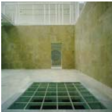
CAAM Foto Sala

3. A partir de las imágenes que se acompañan correspondientes a una sala de exposiciones, efectúa una distribución del espacio organizado por cinco paneles como mínimo, de dimensiones y apoyos diversos, para una exposición fotográfica. Desarrolla mediante plantas y perspectivas un proceso que te lleve a una propuesta concluyente.