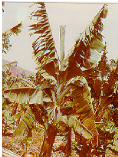
Planta del cultivar "Pequeña Enana afectada de Mal de Panamá.