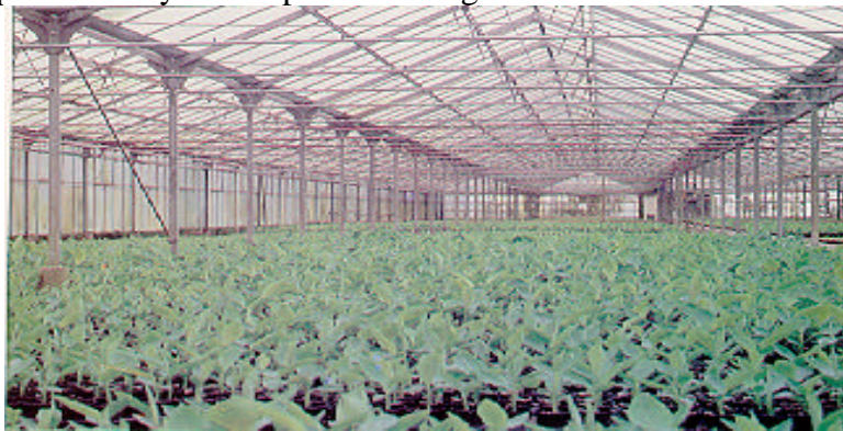
Instalaciones para el endurecimiento de "Gran Enana" procedente de cultivo "in vitro".

Tanto para los casos de "plantaciones intercaladas" como para los de arranque y nuevas plantaciones", se debe tener en cuenta que las labores que se realicen pueden potenciar la enfermedad, ya que contribuyen a dispersar el hongo en el suelo.