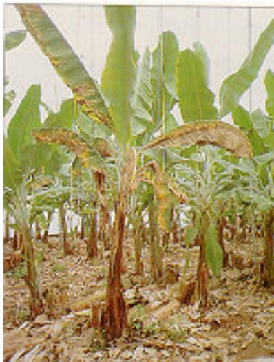
Planta del cultivar "Gran Enana bajo invernadero afectada de Mal de Panamá.

El Mal de Panamá, conocido popularmente en Canarias por "veta amarilla" o "veta negra", es una de las enfermedades vegetales más destructivas que se conocen y una de las más graves de la platanera. Su presencia en Canarias se remonta a los años 30, cuando tuvo lugar un brote epidémico en la zona del Valle de La Orotava, en la isla de Tenerife. En la actualidad afecta a todas las zonas plataneras de las islas y su incidencia es variable, presentando fluctuaciones que hasta ahora lo han evolucionado hacia situaciones epidémicas de gravísimo alcance. Los escasos datos epidemiológicos disponibles indican que el porcentaje medio de incidencia se sitúa entre el 2% y el 12%, aunque se presentan casos aislados de incidencia mucho más alta. Stover y Malo en 1973 estimaron que en el año 1972 un 10% de las plataneras de Gran Canaria padecían la enfermedad y sólo en el 1%-2% de los casos los ataques eran destructivos.