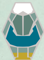
AUDITORIO ALFREDO KRAUS