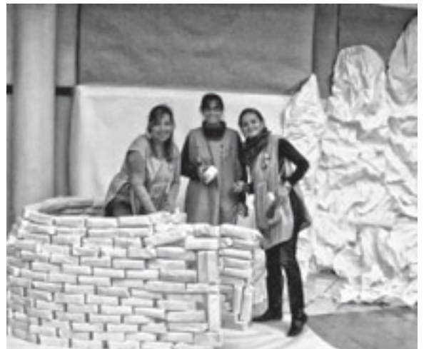
Lo pasamos genial construyendo el rincón del Polo Sur.

Se nos ocurrió que la actividad motivadora que daría inicio al proyecto sería un viaje al Polo Sur que realizarían las mascotas de cada aula de Educación Infantil: “Paco” el tiburón, del aula de tres años; “Alicia” la jirafa, de cuatro años y “Paquita” la vaca, de cinco años. Allí visitarían a sus amigos los pingüinos.