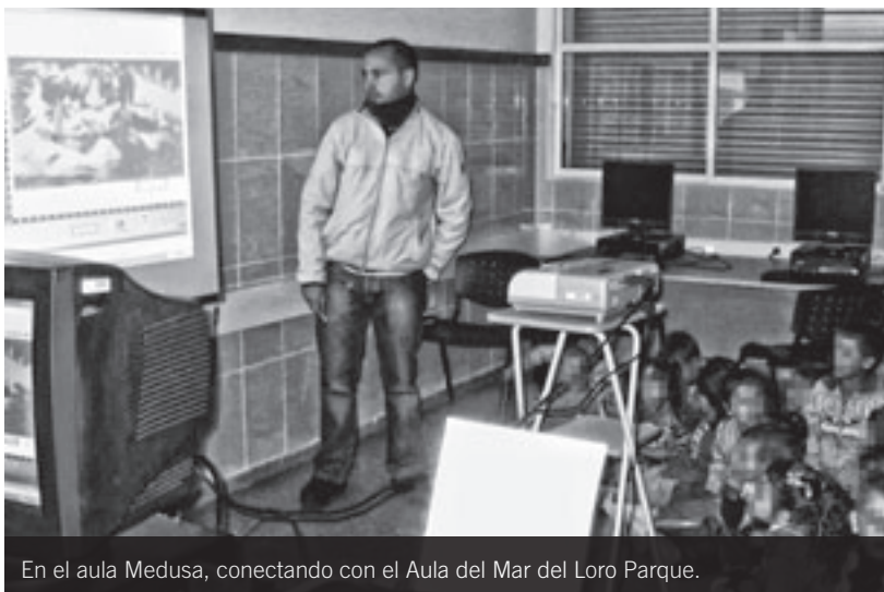
En el aula Medusa, conectando con el Aula del Mar del Loro Parque.

Esperamos que nuestra experiencia les haya gustado. Nosotras hemos trabajado mucho, pero lo dicho, hemos disfrutado más y eso es lo que nos motiva a seguir cada día aprendiendo de nuestro trabajo, mejorándonos y reciclándonos. •