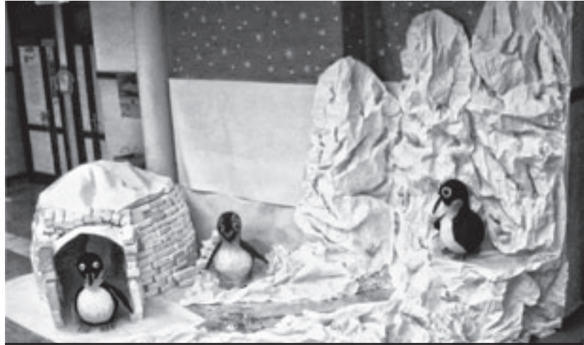
El rincón del Polo Sur con los pingüinos realizados en cada aula.

Las mascotas partieron al Polo Sur y unos días después recibimos una carta donde nos contaban lo bien que lo estaban pasando con sus amigos y que muy pronto volverían.