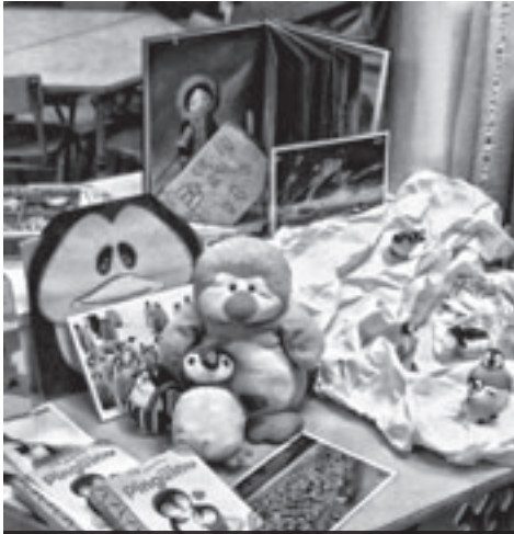
El Rincón del pingüino, visitado por todo el colegio.