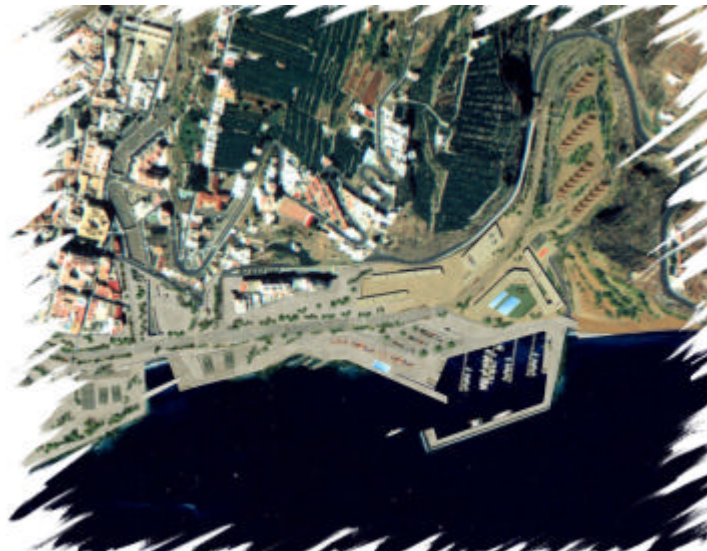
Puerto Deportivo Norte

Se trata de una zona de ocio estrechamente ligada al centro cultural del museo del mar en uno de sus extremos y que consta de varias piscinas naturales abiertas al mar. La zona deportiva norte contará con dos canchas reglamentarias para usos múltiples al aire libre y una zona para escuelas de deportes náuticos. Se incluye también en este espacio, otra zona de chiringuitos, terrazas y aseos públicos, entre las piscinas y escuela deportiva.