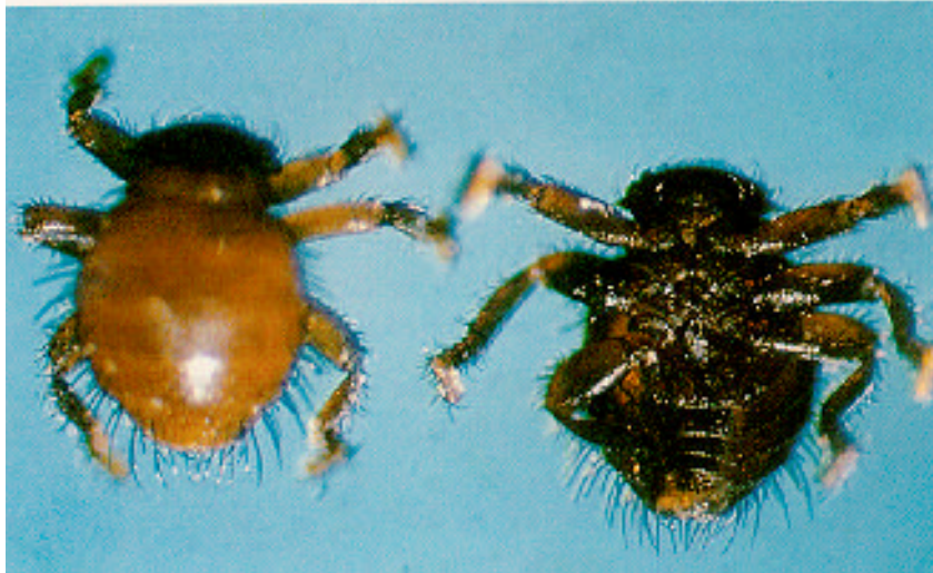
Piojo de las abejas (Braula coeca)