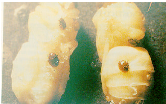
Larva con varroas

La falta de vitalidad de las abejas parasitadas y su muerte prematura, ocasiona un menor aporte de néctar y polen, originando un debilitamiento de la colonia que puede llegar a producir su desaparición.