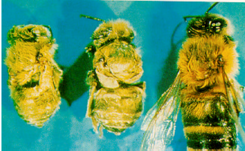
Izquierda: Abejas lesionadas. Derecha: Abeja normal